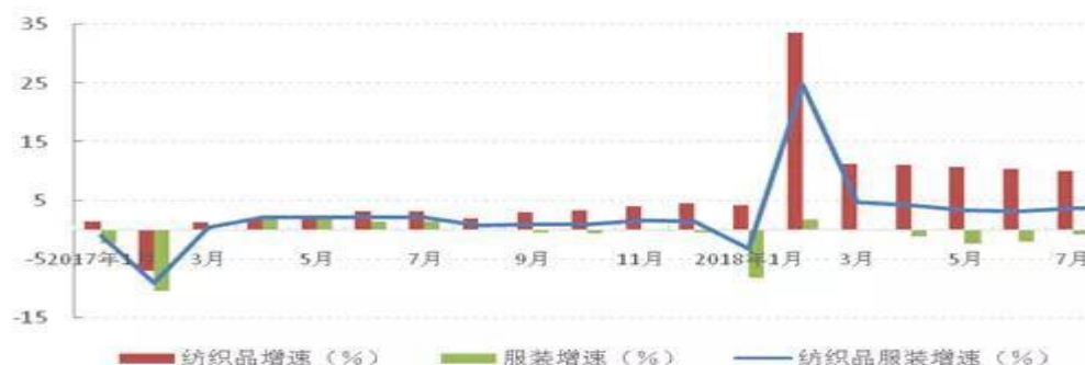
图 2：纺织品服装出口增长情况

出口市场持续回暖。根据海关快报数据，1-9 月我国纺织品服装出口总额（不含 94 章）为 2077.7 亿美元，同比增长 4.6%，增速较上年同期提高 3.7 个百分点，较今年上半年继续加快 1.3 个百分点。分产品结构看，纺织品竞争力稳定，出口额同比增长 10.5%，增速高于上年同期 7.6 个百分点，占出口总额比重提升至 43%；服装受到制造成本高企及订单、投资转移等因素影响，出口压力较大，1-9 月出口额同比仅增长 0.6%。分国别看，对美国、欧盟和日本纺织原料及纺织品服装出口额同比分别增长 8.5%、3.4%和 4.8%，对美出口增速较上年同期提升 9.1 个百分点；对越南、土耳其、印尼等“一带一路”沿线市场出口增势良好，出口额分别同比增长 30%、5.7%和 21.6%。